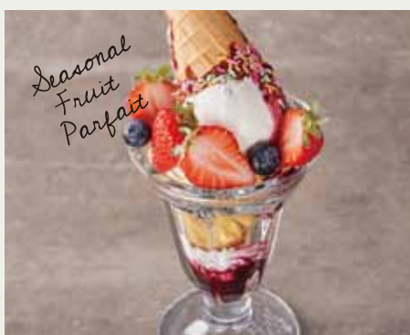
季節のフルーツパフェ 880 (税抜 815)