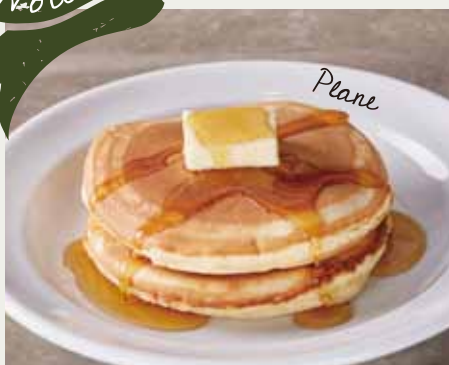
ホットケーキ プレーン 650 (税抜 602)