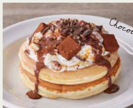
ホットケーキ チョコレート 800 (税抜 741)