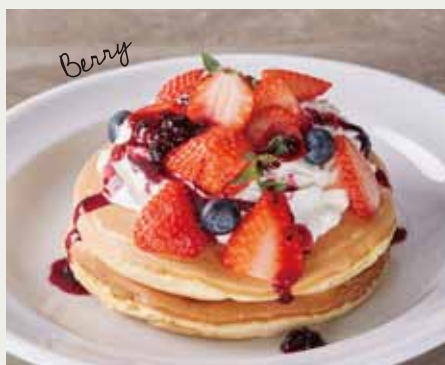
ホットケーキ ベリー 800 (税抜 741)